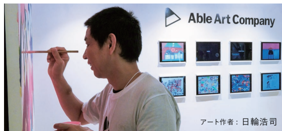
アート作者：日輪浩司

売上の一部が団体、アーティストへ報酬として支払われ、アーティスト活動を援助します。