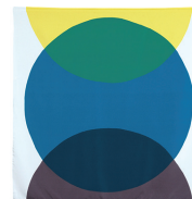
まる ブルーグリーン ●10261-314 JAN: 4515543-114795 10266-312 JAN: 4515543-115419