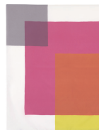
しかく ピンク ●10261-318 JAN: 4515543-114795 10266-313 JAN: 4515543-115419